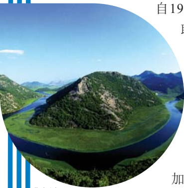
Skadar Lake - Montenegro

自1970年代以来，人们日益认识到环境问题与人权之间的联系。1992年，联合国环境与发展会议(或称“地球峰会”)在里约热内卢召开，会上，178个国家政府通过了至今仍被视为具有里程碑意义的《关于环境与发展问题的里约宣言》，其中正式承认了这一联系。作为一项国际文书，《里约宣言》在原则10中第一次申明，“环境问题最好在所有有关公民的参与下加以处理”，“每个人应有适当的途径获取信息”，有权“参加决策”并可“有效诉诸”法律。