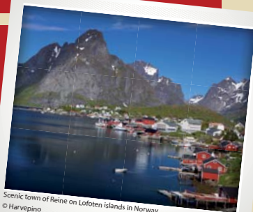
Scenic town of Reine on Lofoten islands in Norway

因此，政务会启程上路，乘电动汽车从一个城镇来到另一个城镇，在集市和城镇广场上搭起宣传大棚，与民众对面谈论气候变化，以及它将如何影响他们的日常生活。政务会努力以新颖的和寓教于乐的方式来吸引民众参与，并利用社交媒体，鼓励尤其是青年人的投入。巡游最突出的成功之处，是扩大了那些本来可能没有机会参与的群体，如老年人和儿童的参与程度。