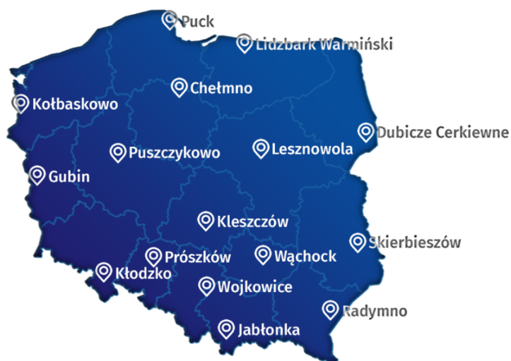
Рисунок 1. Карта с указанием населенных пунктов, выбранных для второй пробной переписи