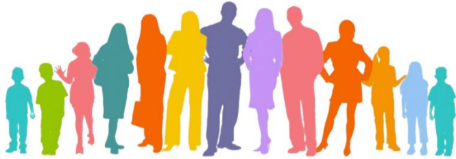
Population (at the beginning of the year, by the thousands)