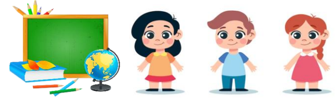
Number of pupils in pre-school education, pupils of general secondary education and primary vocational education(2022; by the thousands)