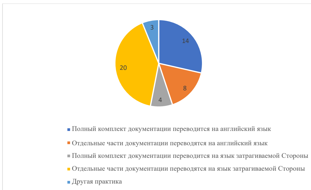
Рис. 3 Ответы на вопрос П.10

63. Сообщается о ряде трудностей, связанных с письменным и устным переводом (вопрос П.6), в числе которых: