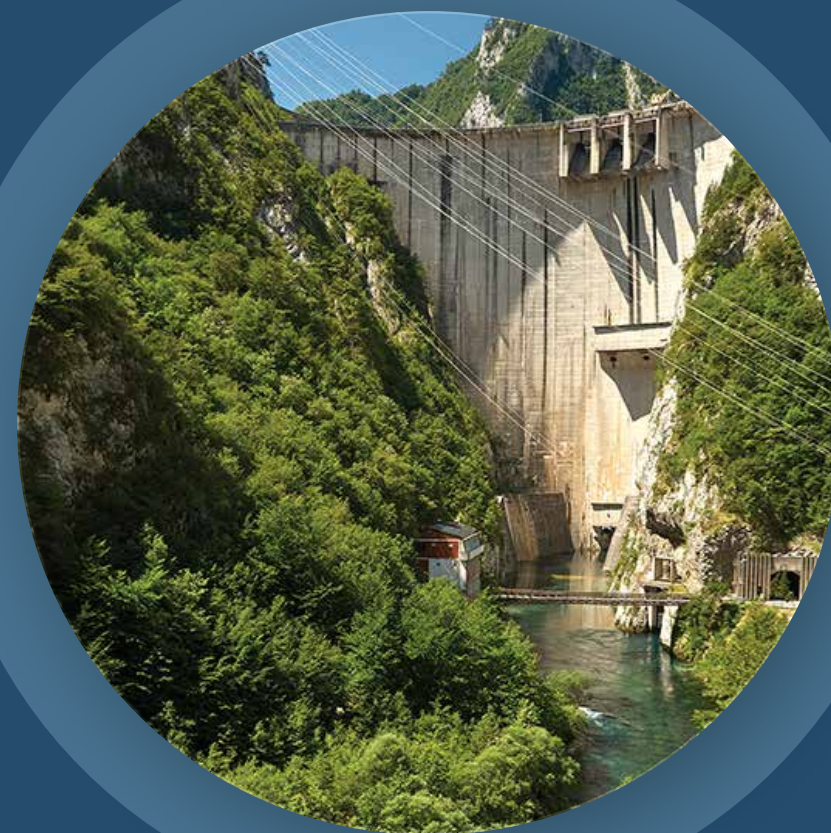
OBLIKOVANJE VODENO- ENERGETSKE VEZE U BASENU REKE DRINE

U NASTAVKU SU PREDSTAVLJENI GLAVNI NALAZI OVIH ANALIZA.