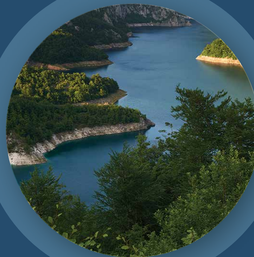
A NEXUS ROADMAP FOR THE DRINA RIVER BASIN