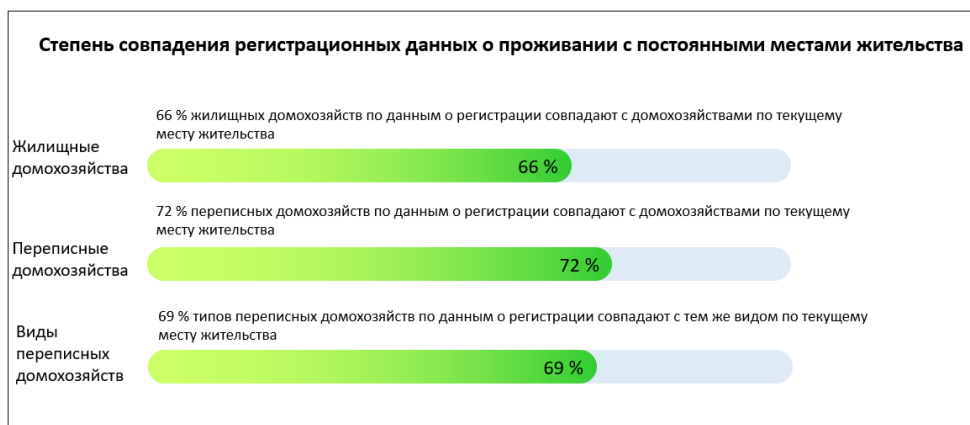
Степень совпадения домохозяйств на основе данных о текущем и постоянном местах жительства