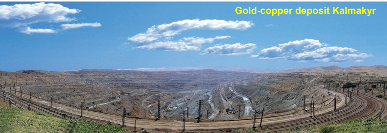
Gold-copper deposit Kalmakyr