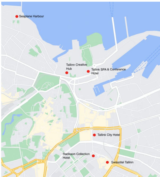
Карта с рекомендуемыми гостиницами и местами проведения мероприятий