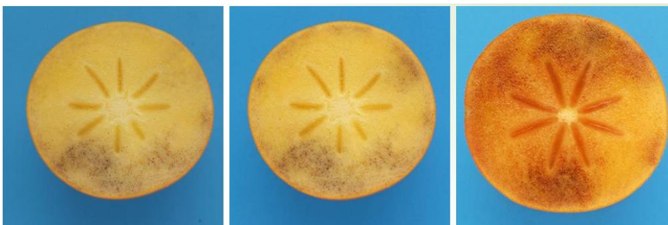
Class I photo 48