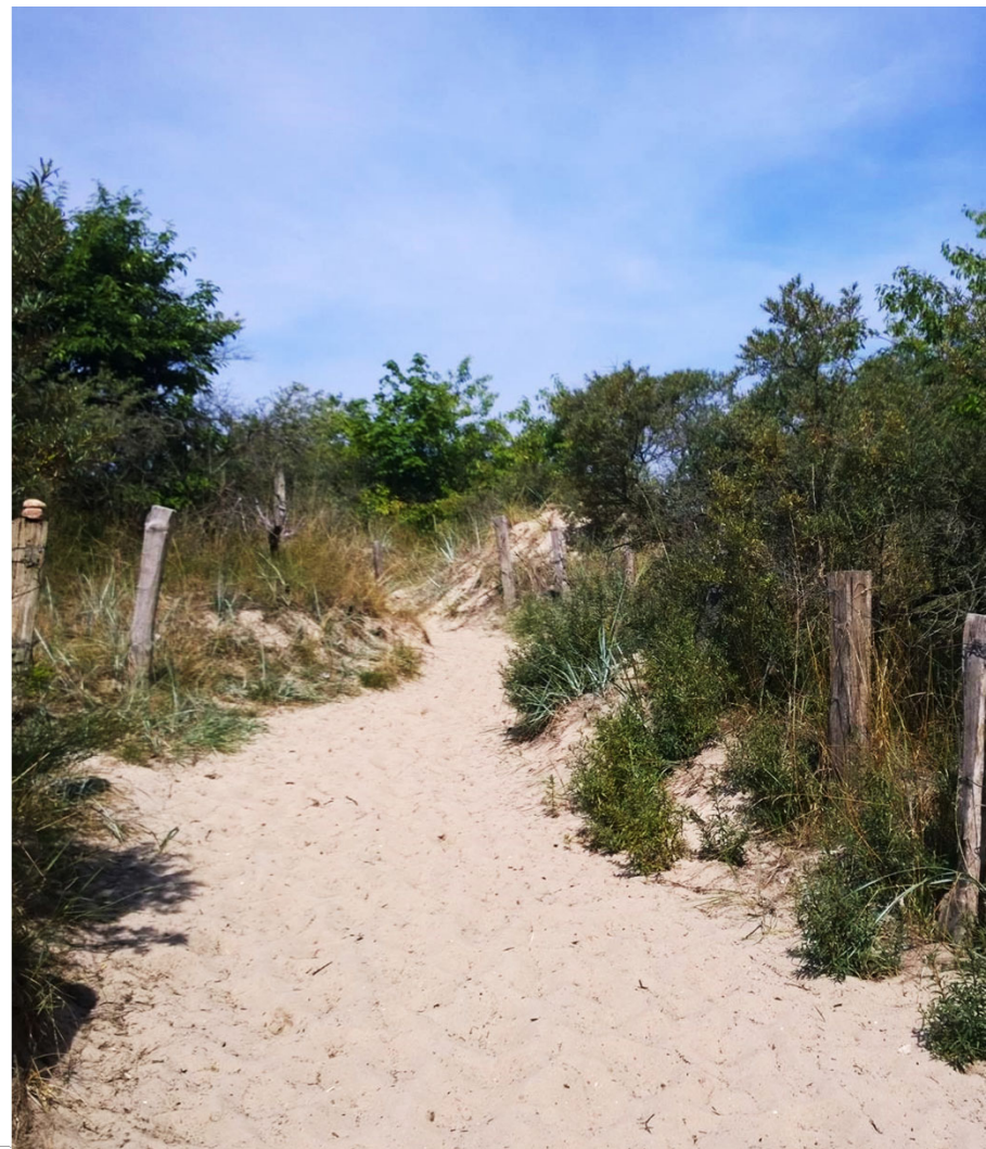
Дорога к пляжу, Travemünde Priwall, фото Свена Кауманса