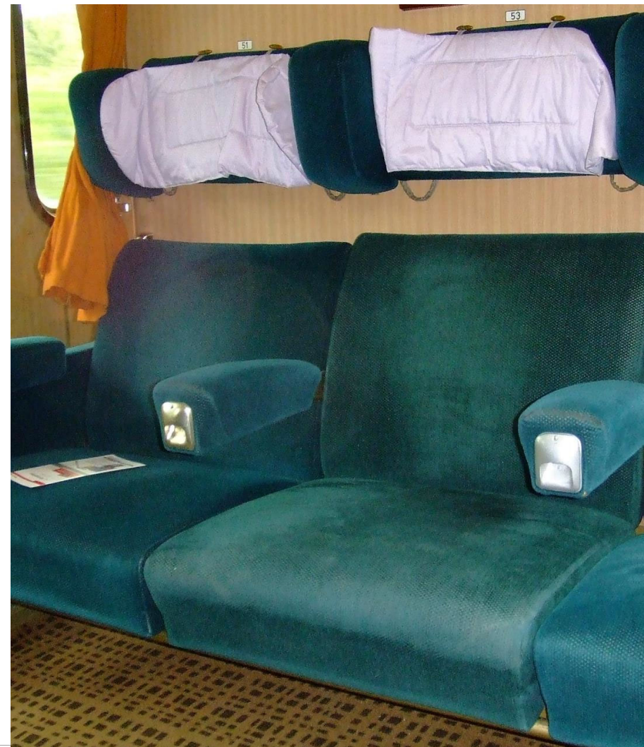
Empty old 1st class IC seats