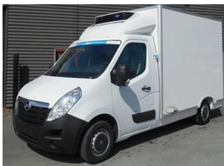
Cas N°4 : Fourgons de série avec isolation intégrée et groupe installé sous châssis ou dans le compartiment moteur :