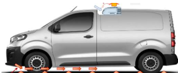
Cas N°2 : Fourgons de série avec isolation intégrée et groupe partiellement encastré en pavillon et avec présence d'un déflecteur de pavillon :