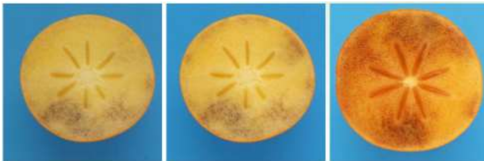
Первый сорт — фотография 48