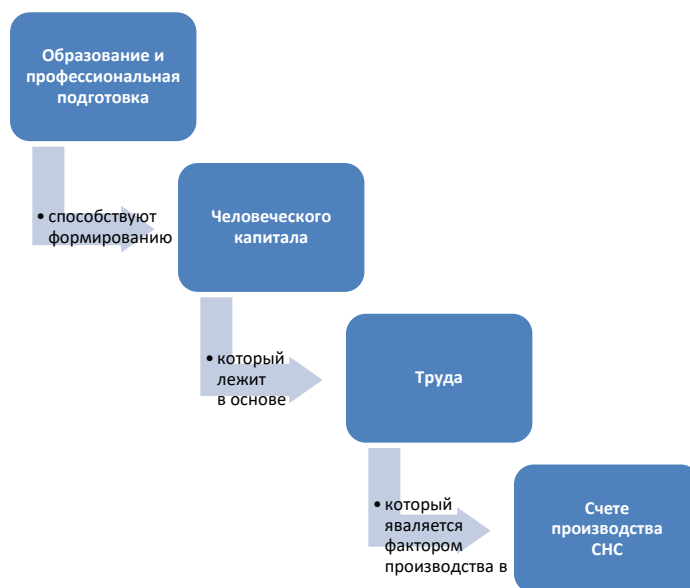
Рис. 1 Связи между образованием, человеческим капиталом и трудом и структурой национальных счетов

7. Нижеследующие разделы настоящего документа охватывают: