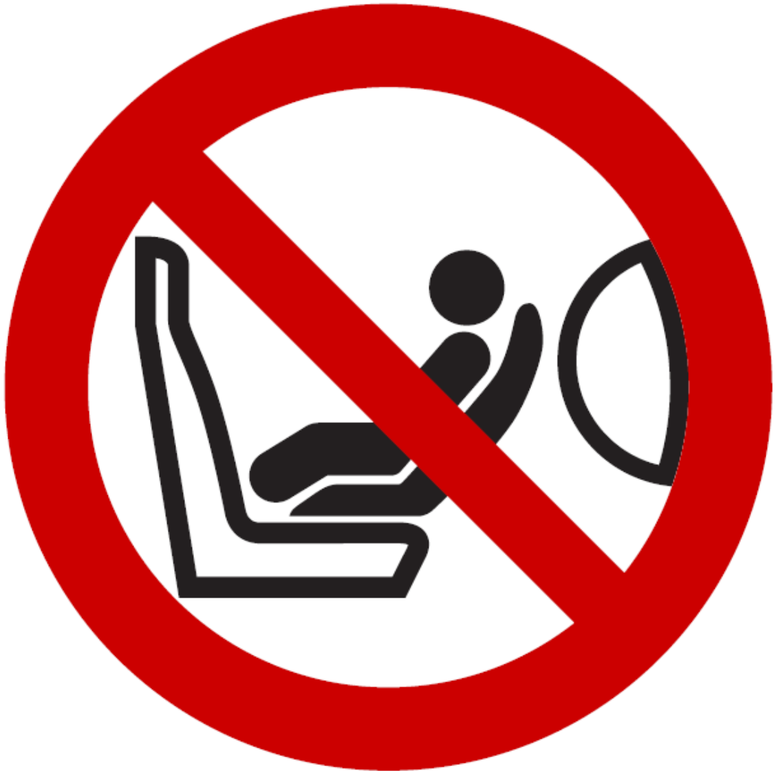
Figure B Pictogramme à utiliser, conforme à la norme ISO 2575:2004 – Z.01, dont le diamètre extérieur doit être d'au moins 38 mm