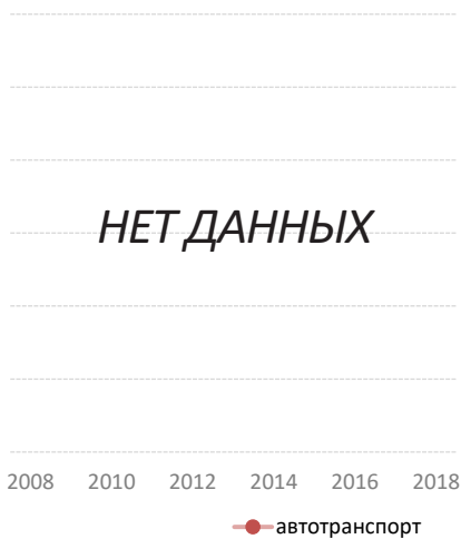
Тонн-км по режиму (млн.) и модальной доле (в %)