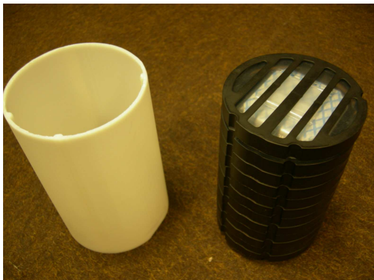
Emballage extérieur pour magasins ou cartouches