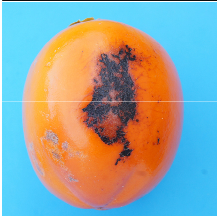
Photo 45b Catégorie I « légers défauts de l'épiderme » Légers défauts de l'épiderme du aux frottements affectant 1/16 de la surface totale du fruit Limite admise