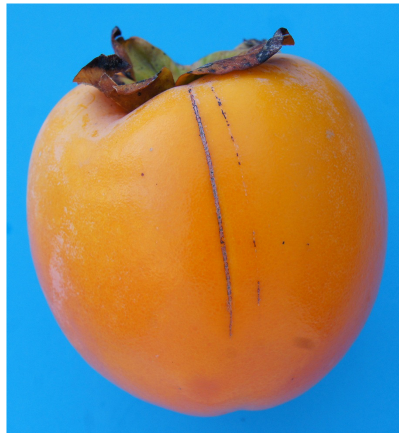
Photo 42 Catégorie I « légers défauts de l'épiderme » Des lignes fines et cicatrisées mesurant au total la distance entre l'apex et le calice Limite admise