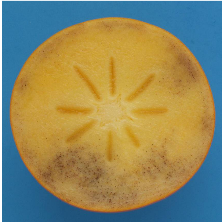
Photo 50 Class I “slight internal discolouration” Slight internal discolouration affecting 1/3 of the cross-section Limit allowed

Alternativ photo no. 2, less internal discolouration = closer to 1/3