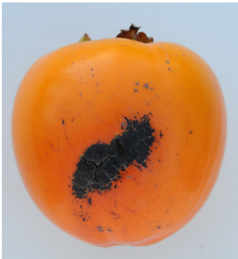
Photo 45b Class I “slight skin defects” Rubbing affecting in total 1/16 of the surface of the fruit Limit allowed

delete cracks and make black area somewhat lighter in colour