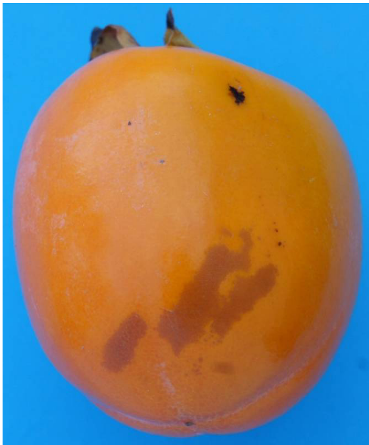
Photo 45a Class I “slight skin defects” Rubbing affecting in total 1/16 of the surface of the fruit Limit allowed

delete the black spot, enlarge the brownish area