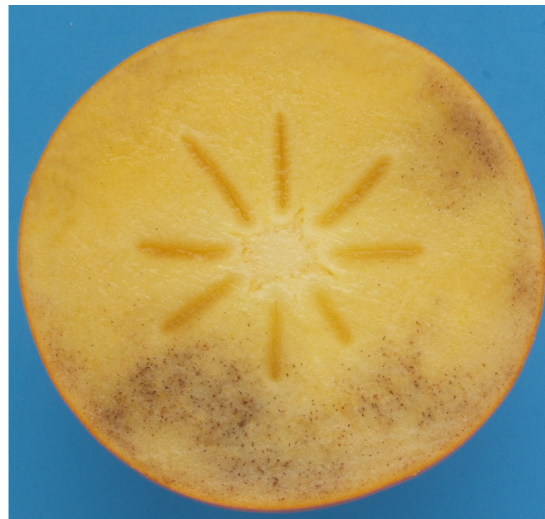
Photo 50 Catégorie I « Une légère brunissement interne de la chair» Une légère brunissement interne affectant 1/3 de la section transversale Limite admise