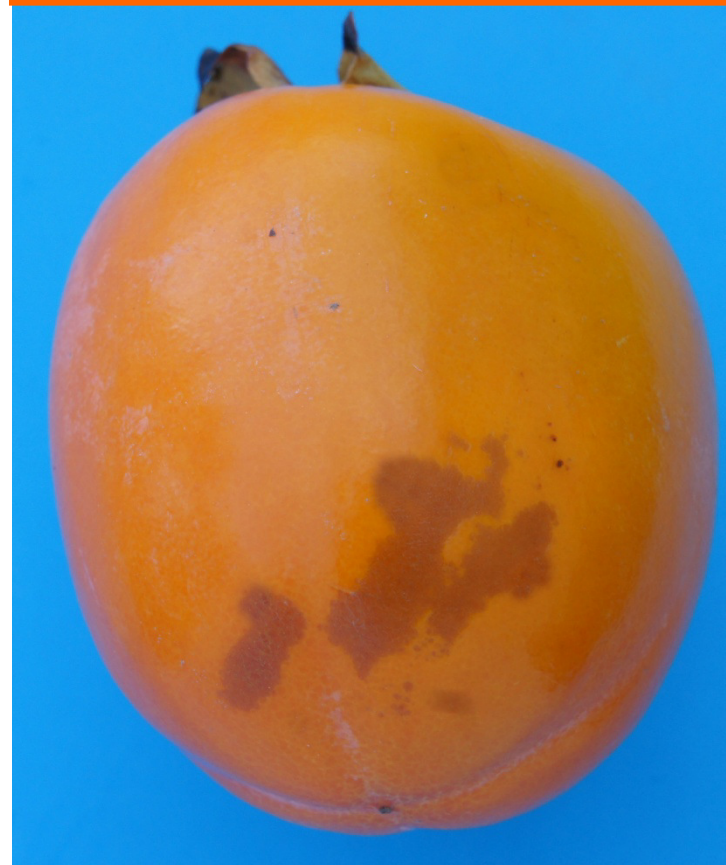
Photo 45a Catégorie I « légers défauts de l'épiderme » Légers défauts de l'épiderme du aux frottements affectant 1/16 de la surface totale du fruit Limite admise