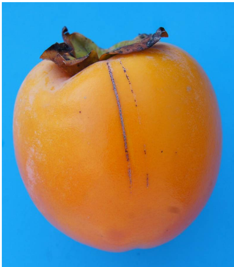
Photo 42 Class I “slight skin defects” Fine corky lines measuring in total the distance between the pistil end and the calyx Limit allowed