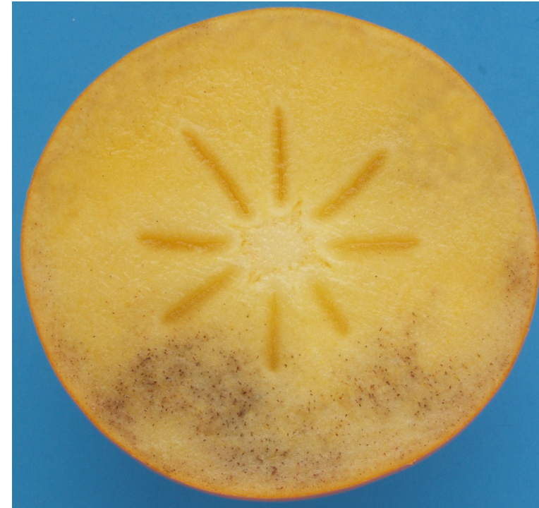
Photo 50 Catégorie I « Une légère brunissement interne de la chair» Une légère brunissement interne affectant 1/3 de la section transversale Limite admise