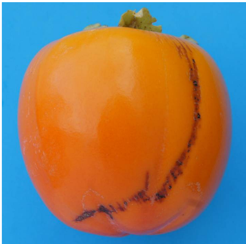
Photo 44 Class I “slight skin defects” Rubbing affecting in total 1/16 of the surface of the fruit Limit allowed

Alternativ photo, shorter “line” = more 1/16 of the surface