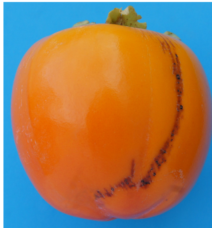
Photo 44 Catégorie I « légers défauts de l'épiderme » Légers défauts de l'épiderme du aux frottements affectant 1/16 de la surface totale du fruit Limite admise