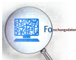
© Maksim Kabakou - Fotolia.com / eigene Bearbeitung