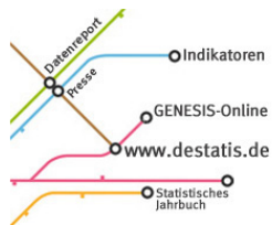
© chagpa - Fotolia.com / eigene Bearbeitung