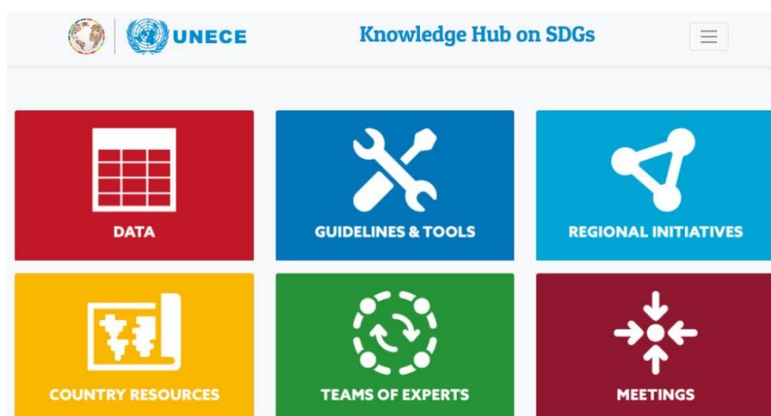
Figure 1 Interface du pôle de connaissances sur les ODD

7. Ce pôle de connaissances a été lancé le 2 décembre 2019. Le secrétariat de la CEE l'actualisera en permanence et le complétera par de nouvelles informations.