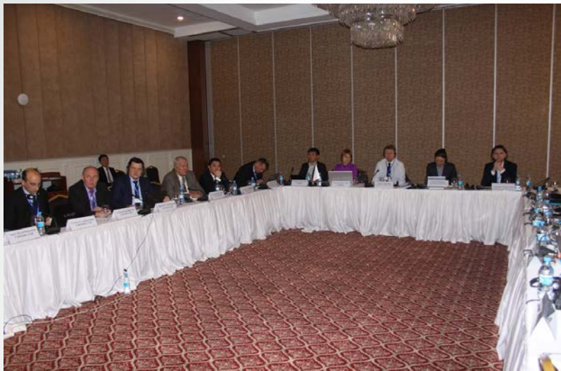
1-ый субрегиональный семинар, 9 фев. 2017, Алматы