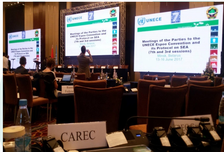
Участие в Сессии Сторон, июнь 2017, Минск