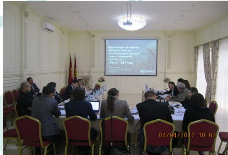
Национальный семинар, 4 апр. 2017, Бишкек