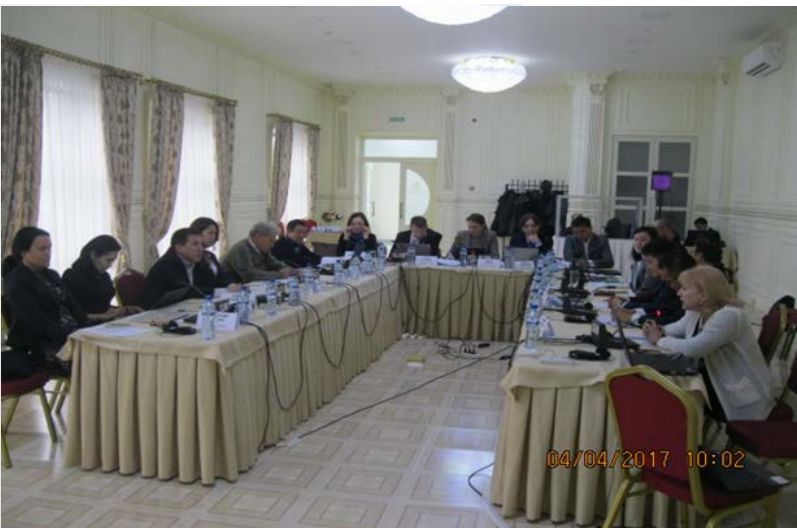
2-ой субрегиональный семинар, 5 апр. 2017, Бишкек