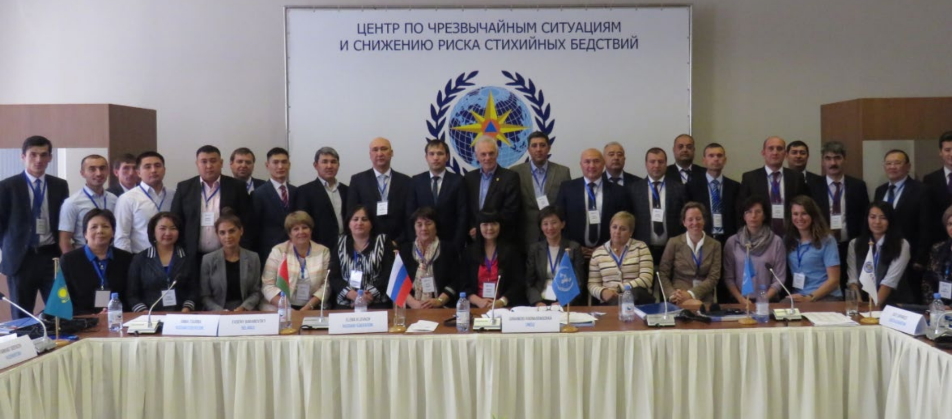
Групповая фотография после 1-й СЕССИИ в 12:30