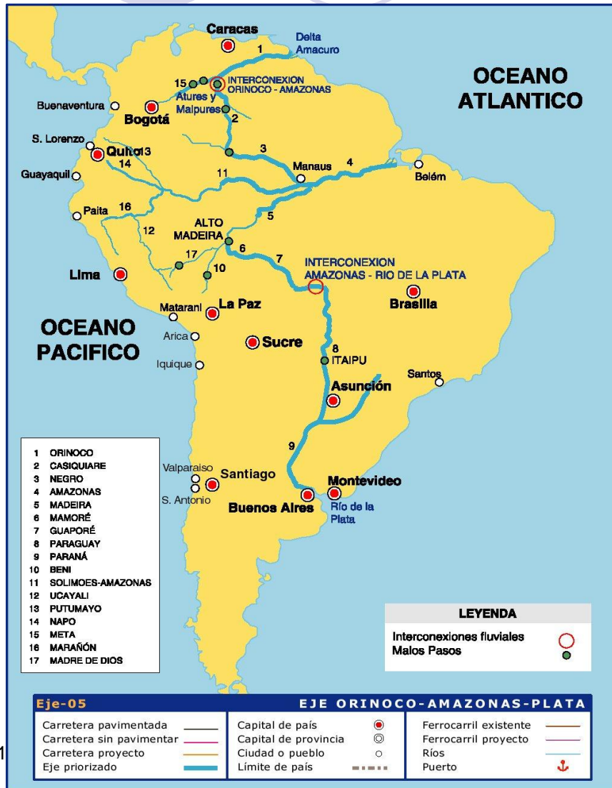
Sistemas Acuíferos Transfronterizos de las Américas