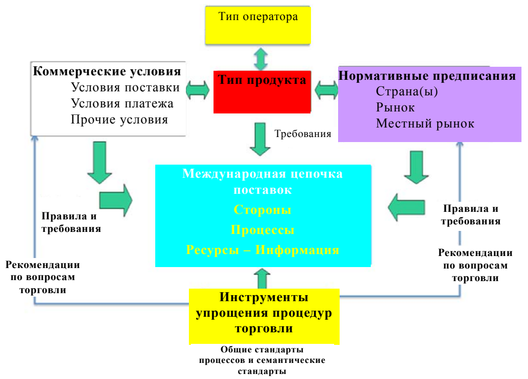
Диаграмма 1 Важнейшие элементы, влияющие на торговые процессы