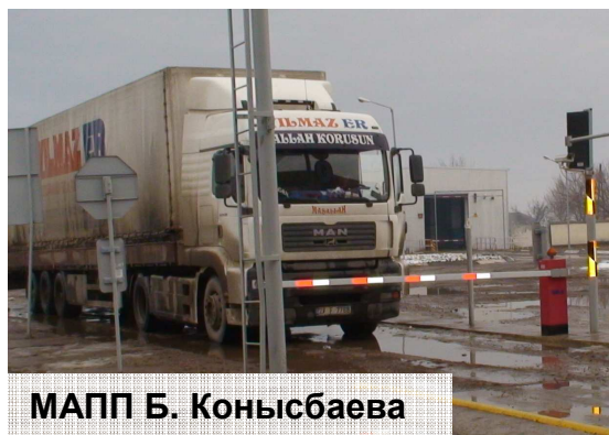
МАПП Б. Конысбаева