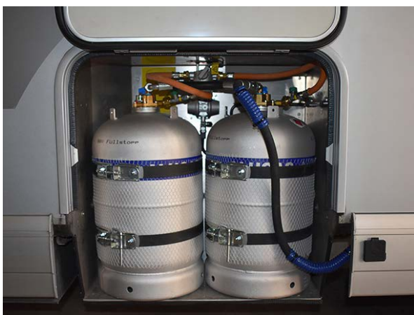
Figure 3 Remplissage d'une bouteille fixe