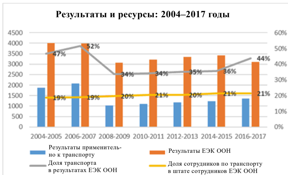
Рис. 3 Результаты и ресурсы: 2004–2017 годы

41. Нехватка ресурсов не дает возможности взять на себя новые задачи, если они не финансируются за счет внебюджетных ресурсов или если не завершены текущие задания.