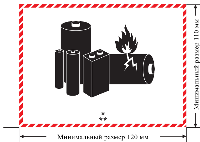
Маркировочный знак литиевых батарей