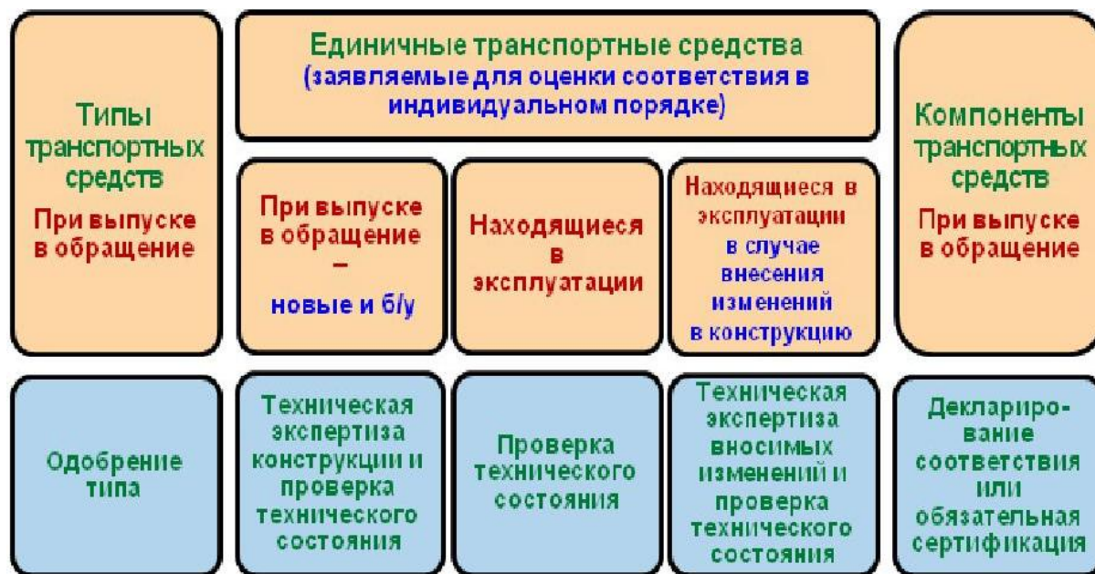
Рис. 1. Объекты технического регулирования и формы оценки соответствия

Принимая во внимание установленный в российском законодательстве принцип соответствия технических требований уровню развития национальной экономики, ряд требований, включенных в перечень, имеет разные уровни жесткости, и установлены сроки постепенного перехода к применению требований более высокого уровня.