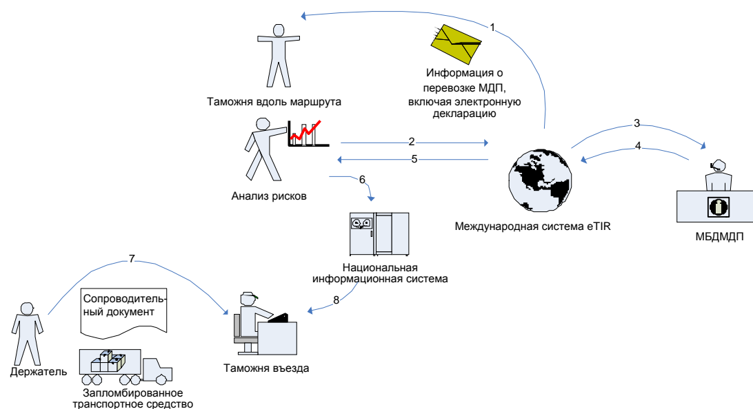
Рис. 2 - Представление декларации в таможенном въезде.

6. На рис. 2 приводится описание всех шагов, связанных с процессом представления декларации в таможенном въезде. Эти шаги пронумерованы и описаны в тексте под рисунком.