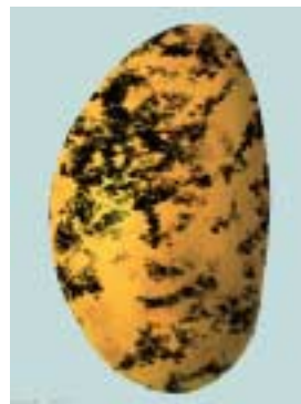
Répartition homogène des taches