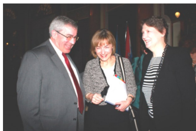
Слева направо: Свен Алкалай, Исполнительный Секретарь ЕЭК ООН, Весна Пусич, первый заместитель премьер-министра и Министра иностранных и европейских дел Хорватии, Администратор ПРООН Хелен Кларк.

Исполнительный секретарь также провел двустороннюю встречу с Администратором ПРООН Хелен Кларк. Он подчеркнул высокий уровень сотрудничества между двумя организациями и предложил ПРООН внести свой вклад в работу Специальной программы ООН для экономик Центральной Азии (СПЕКА). Такой вклад может принять форму субрегиональной дискуссии по программе развития после 2015 года во время проведения Экономического форума СПЕКА в 2013 году и совместных проектов технического сотрудничества в рамках соответствующих проектных рабочих групп. Сотрудничество между региональными советниками ЕЭК ООН и ПРООН также может быть усилено с целью укрепления взаимодействия и согласованности в предоставлении Организацией Объединенных Наций региональных консультативных услуг в странах Европы и Центральной Азии. □