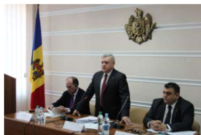
Обращение министра окружающей среды Георге Шалару к обзорной миссии ЕЭК ООН.

Обзор, включая проект рекомендаций для страны, будет рассмотрен на заседании Комитета по экологической политике в Женеве в октябре сего года с участием правительственной делегации Республики Молдова. □