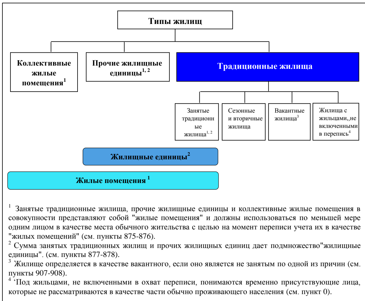
Диаграмма 7. Различные типы жилищ

871. Строение, в котором расположено жилище, рассматривается как косвенная, но важная единица наблюдения при проведении переписи жилищного фонда, поскольку сведения относительно строения (тип постройки, материал наружных стен и некоторые другие характеристики строения) необходимы для правильного описания жилых помещений, расположенных в данном строении, а также для разработки жилищных программ. При переписи жилищного фонда вопросы, касающиеся характеристик строения, обычно составляют инструментарий опроса в отношении того строения, в котором расположены подлежащие регистрации жилые помещения, и сведения регистрируются по каждой жилищной единице или иным находящимся в нем жилым помещениям.