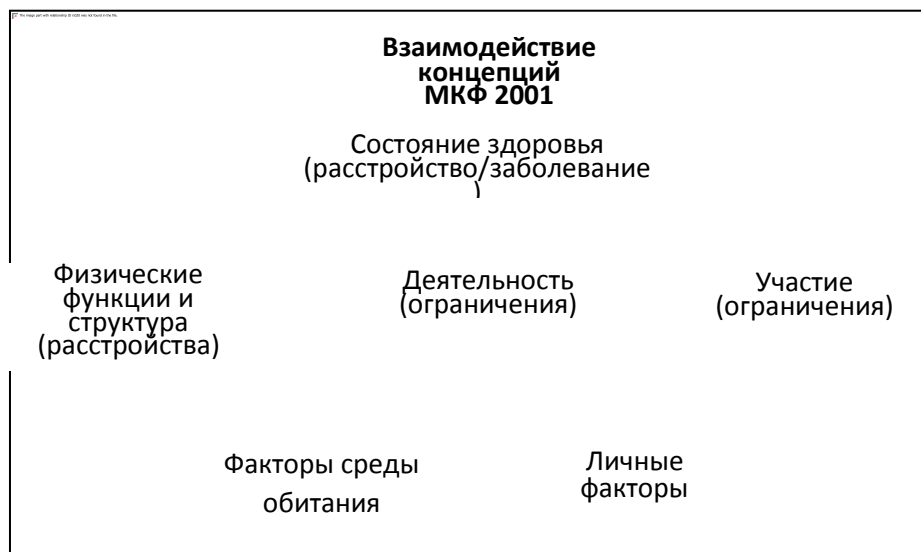
Диаграмма 6. Взаимодействие концепций инвалидности

744. Тремя основными категориями целей измерения инвалидности в рамках переписи являются: