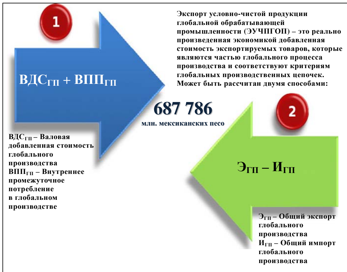
Диаграмма 2 Расчет ЭУЧПГОП в Мексике, 2008 год