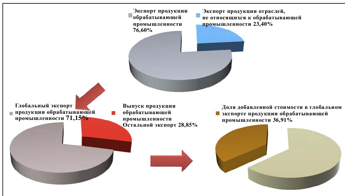
Диаграмма 3 Экспорт продукции обрабатывающей промышленности и ДСГЭПОП, 2008 год (в %)