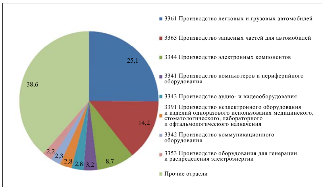
Диаграмма 5 Структура ЭУЧПГОП, 2008 год (в %)