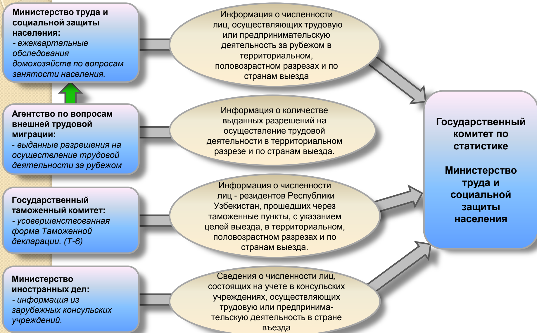
Схема учета численности лиц выезжающих за рубеж для осуществления трудовой деятельности